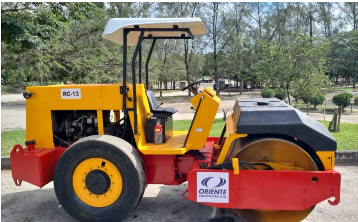
Exemplo de Rolo Chapa Adesivado