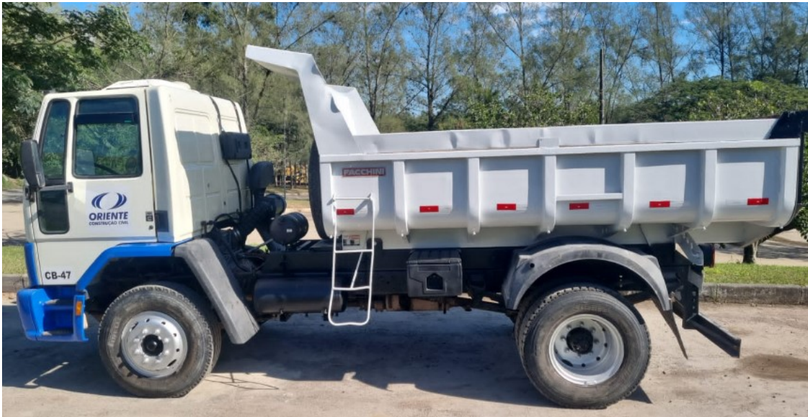
Exemplo de Caminhão Adesivado